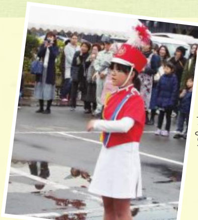
恒例！亀ヶ崎小学校金管バンドの演奏が始まりますよ！

ほほ笑み祭りは、会場設営、作品展示、喫茶ランチ作り、ほほえみ募金など多くの方々の力の結集です。みんなの思いが一つになって、大きな祭典の花が咲きました。