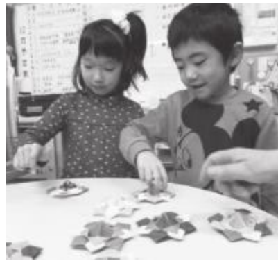
わあー、くるくる回ってる…