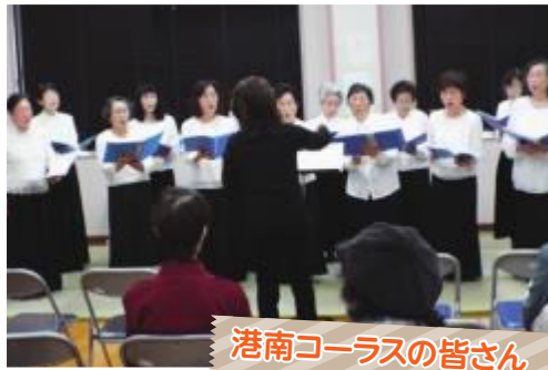
港南コーラスの皆さん