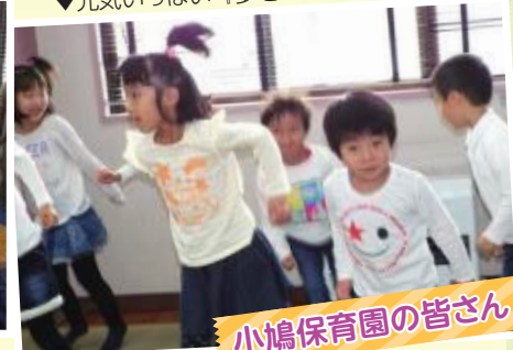
小鳩保育園の皆さん