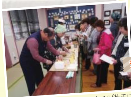
シフォンケーキ作り