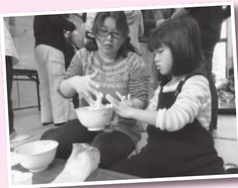
初めて参加したけど楽しかったよ。ピザもおいしかったよ。

今回のおもしろ広場は「ピザにちょうせん」です。参加者は、小麦粉で手指をネバネバにしなが「ワーキャー」と楽しそうに丸めています。30分ねかせた生地をウインナ・パプリカ・チーズなどを沢山のせてオープンで焼き上げました。チーズの焼けた香りが集會室中に広がりました。いよいよ試食タイムです。「んめの〜、簡単だけの」と大好評でした。