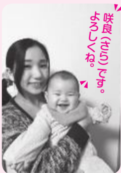
妹(わが)ちゃん。おめでとう。

日々成長する姿を見ることができて、幸せを感じております。教室がある日は両親に娘を見てもらい、生徒の皆さんと体を動かす事はとても気持ち良く、ちよつと良い息抜きをしながら娘と成長したいです。