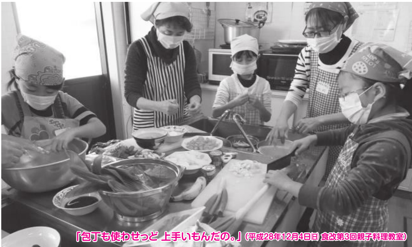
「包丁も使わせっど上手いもんだの。」(平成28年12月4日日 食改第3回親子料理教室)