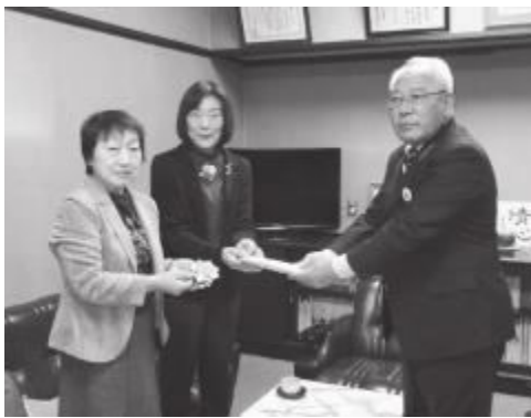
市社会福祉協議会へ募金を寄付

今年度の第3回ほほ笑み祭りの目標「社会貢献を含めた企画事業の推進」を受けて、女性部連絡協議会では、皆が遊べる「折り紙コマ」を作り募金活動をすることにしました。さっそく自治会毎にお願いしたところ、数日後、完成のコマを届けてくれた女性部長を始め、皆さん頑張ってくれました。9月には目標の数を大きく上回って、約700個の折り紙コマが集まりました。