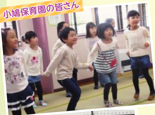
小鳩保育園の皆さん