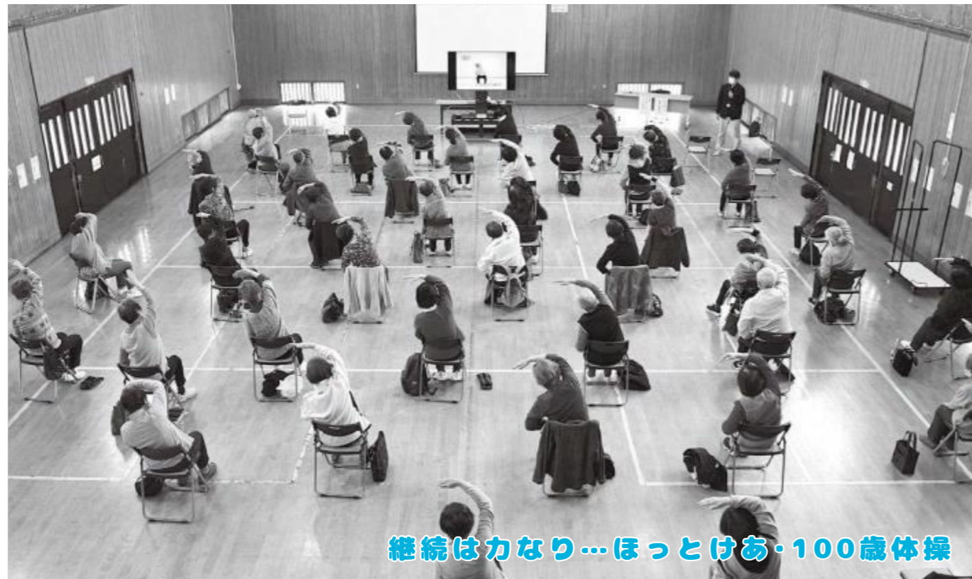
継続は力なり...ほっとけあ・100歳体操