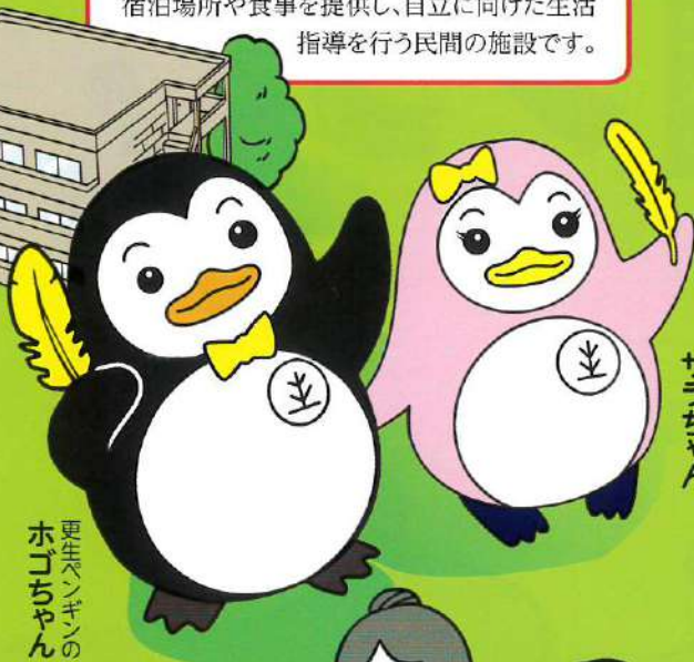
更生ペンギンの ホゴちゃん

刑務所等を出た後、帰る場所がない人たちに宿泊場所や食事を提供し、自立に向けた生活指導を行う民間の施設です。