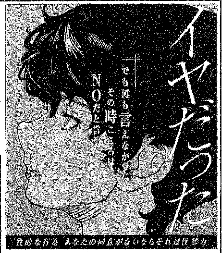
性的な行為 あなたの同意がないならそれは性暴力